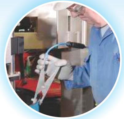
Pince universelle de mise à la terre et raccord Quick Connect inclus