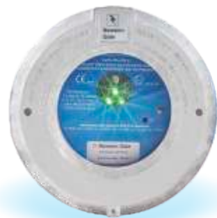
DEL à impulsion pour confirmer une bonne connexion.

Pour découvrir d'autres utilisations de l'Earth-Rite PLUS, contactez Newson Gale ou ouvrez une session sur notre site Internet pour demander une copie gratuite du manuel des applications de liaison et de mise à la terre.