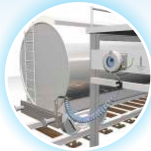
Chargement des véhicules de chemin de fer