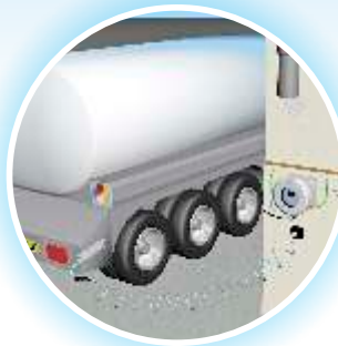
Chargement des camions-citernes*